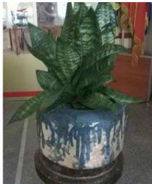
А Рисунок 5. а — эскиз композиции для гобелена «Танец»; б — декоративные вазы «Зимнего сада»