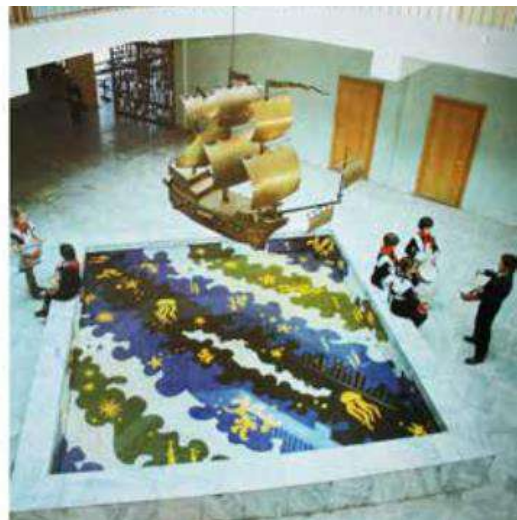
А Рисунок 6. а — эскиз декоративной решетки; б, в — корабль, бассейн