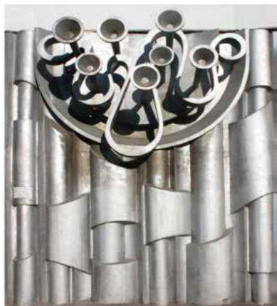
А б Рисунок 2. а — декоративные часы «Знаки Зодиака» (выколотка, тонированный алюминий); б — декоративное панно «Горны» (крой из металла)

Перед центральным входом, в парковой зоне, на площадке расположен бассейн-фонтан, украшенный мозаикой на тему «Жизнь моря» (общая площадь бассейна 200 \text{ м}^2 ) (рис. 3). Автор мозаики — Веналий Артемович Санников , получивший образование в художественном училище г. Владивостока (отделение живопись 1959–1964), а затем продолживший обучение в СПГХПА им. А. Л. Штиглица (отделение декоративной живописи 1964-1970). Присвоено звание «Заслуженный художник Российской Федерации».