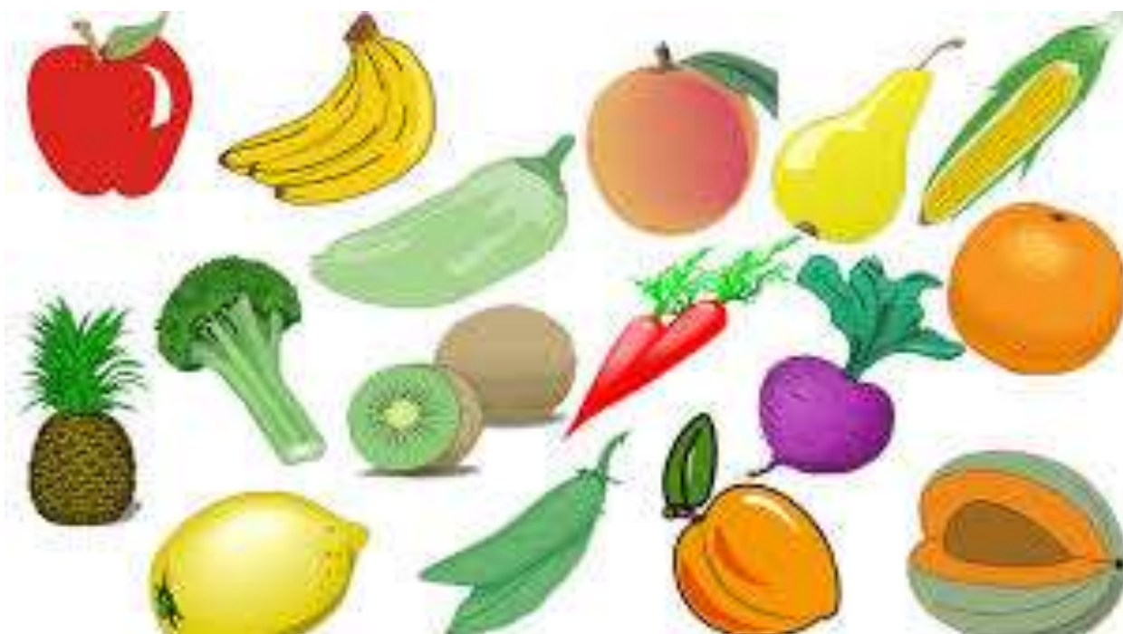
Разнообразие фруктов и овощей