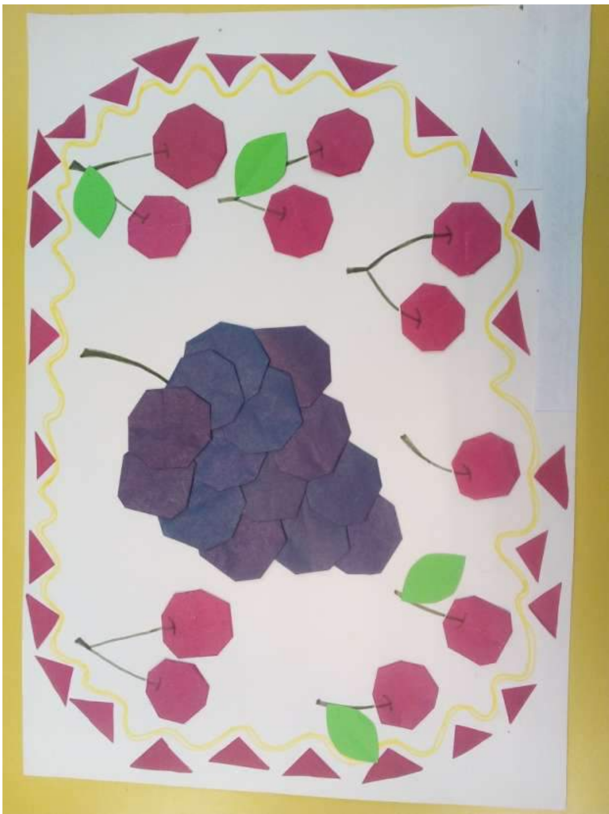
Образец коллективной работы